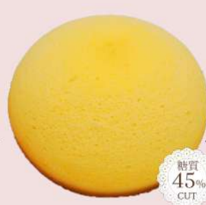
まる〜いチーズフレ