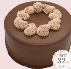
ショコラバースデーケーキ

4号<12cm> ¥2,500 5号<15cm> ¥3,300 6号<18cm> ¥4,300