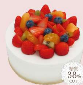
フルーツバースデーケーキ

4号<12cm> ¥3,300 5号<15cm> ¥4,400 6号<18cm> ¥5,500