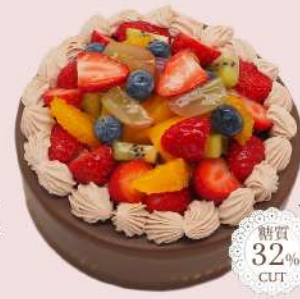
フルーツショコラバースデーケーキ

4号<12cm> ¥2,800 5号<15cm> ¥3,900 6号<18cm> ¥5,000