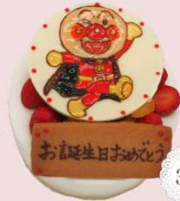
キャラバースデーケーキ

4号<12cm> ¥3,800 5号<15cm> ¥4,700 6号<18cm> ¥5,600