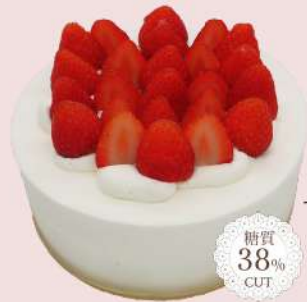
苺のバースデーケーキ

糖質をおさえているのに、甘くて美味しいバースデーケーキ。予約特典プレゼントがあります。2日前までの予約注文のみの販売となります。 フルーツをのせたり、チラシ以外のケーキのリクエストなどのご要望がありましたら、お気軽にお尋ねくださいませ。