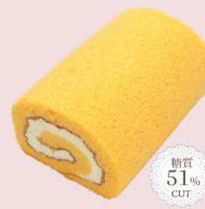
すいらぼ純生ロール